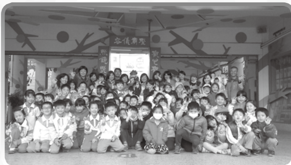
★ 五周年慶傳遞聖火迎接貓頭鷹寶寶