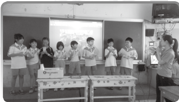
★ 孩子們上台分享外星生物