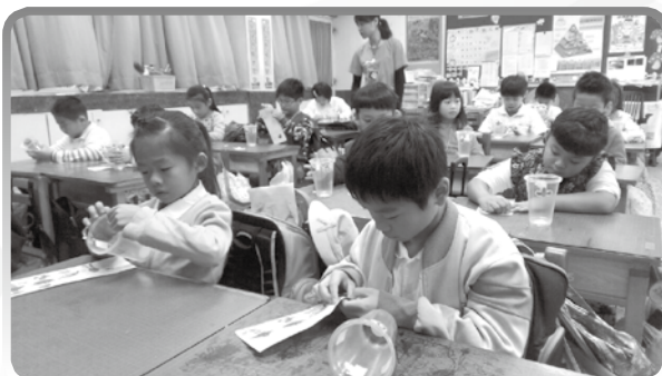
★ 自製外星生物照型杯