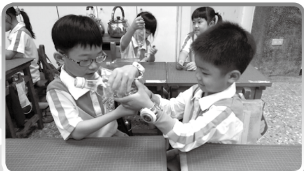
★ 一起來玩星系碰撞吧！