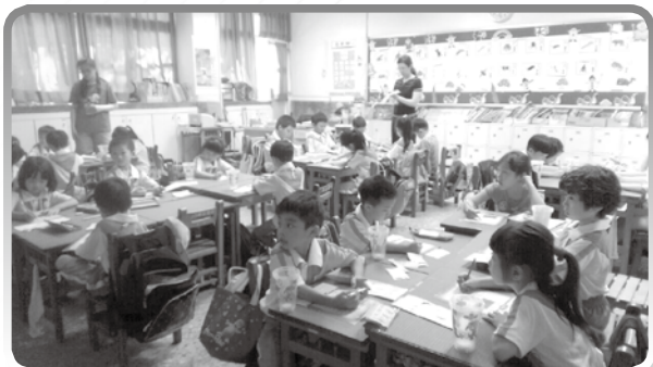
★ 天文課程教學學習單