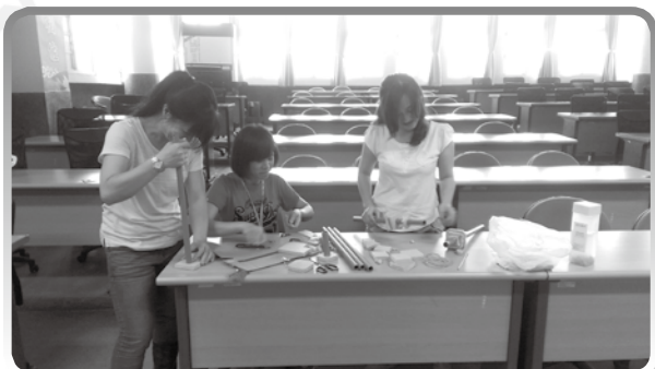
★ 自製天文課程教具