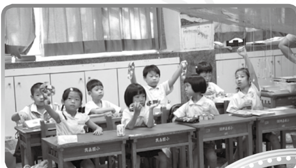
★ 全班一起製作編織美麗的銀河系