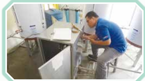
▲飲用水設備消毒及保養