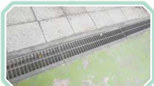
▲一樓中庭水溝龜裂修護整修照片