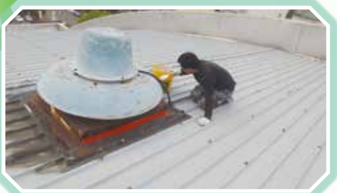
▲體育館屋頂消防排煙口除繡防水處理