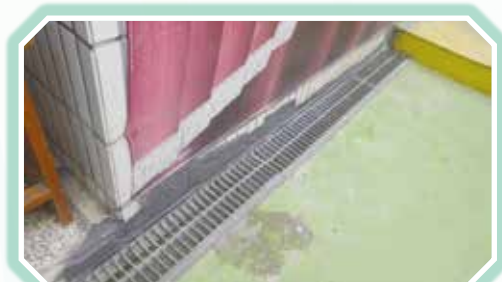
▲地下室外水溝龜裂修護整修照片