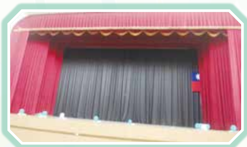
▲體育館大布幕更新