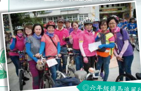
◎六年級鐵馬追風行