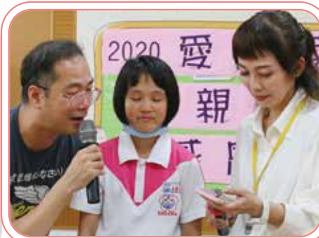
▲call out 傳真情