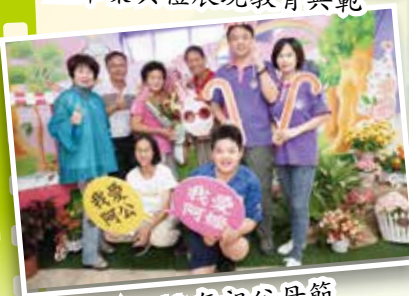
▲ 109 年祖父母節