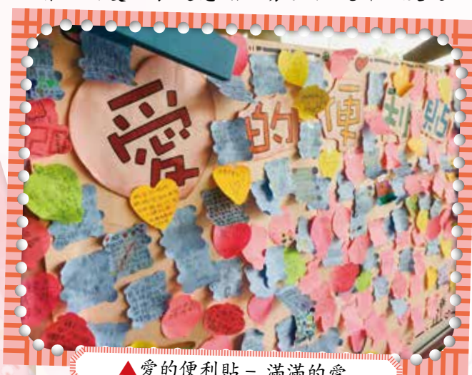
▲愛的便利貼——滿滿的愛

溫馨的5月，雖受疫情影響沒有辦理大型慶祝活動，但一連串的感恩系列活動，使今年的母親節倍感溫馨感人。孩子們在這個特別的日子裡，學習體貼媽媽、家人及照顧者，用愛語表達感謝，讓全校親師生度過一個感恩、歡樂的母親節！