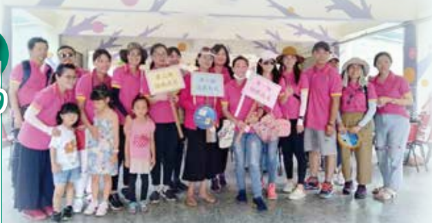
▲上帝的金戒指－日環蝕