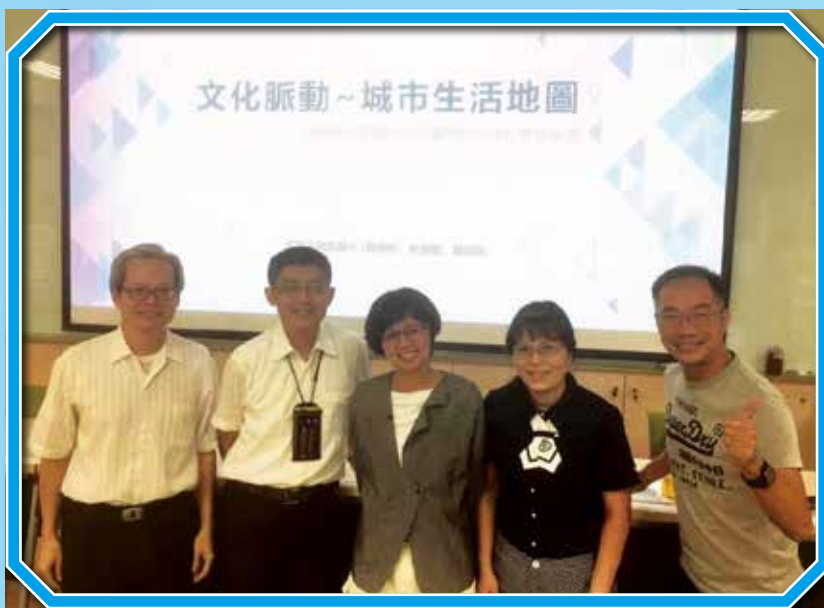
▲教師團隊受邀於研討會分享文化脈動—城市生活地圖課程

綜合這十年對圳的理解與從圳發展而出的環境教育思維，以及興嘉城市學校的特性，本校欲由更高角度看待「學校」、「圳」與「環境」的關係，取道將圳「圳道」開展的「生活」、「生產」、「生態」本質，站在「城市發展」的高度看待「地方」，108學年度始以「城市城事」課程方案延續「道將風華好鄉土」課程，循著「從一條圳進入城市生活」的路徑滾動式修正課程，回應「理想生活與宜居城市」。課程從地理實察，覺察環境，建構出更完整具備「基