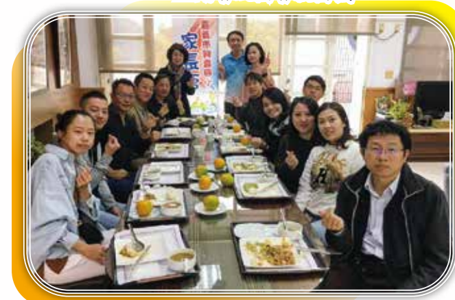
▲ 校長室聚餐凝聚教育共識