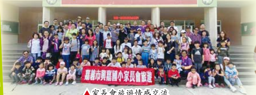
▲ 家長會旅遊情感交流