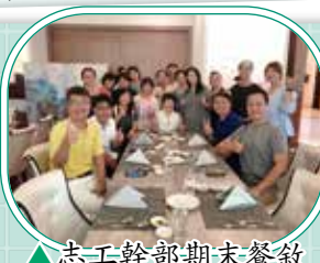
▲志工幹部期末餐敘