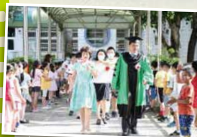
▲ 畢業典禮展現教育典範