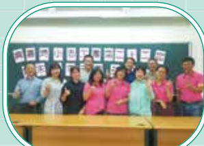
▲期末大會暨團長選舉