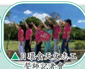
▲日環食天文志工 誓師記者會