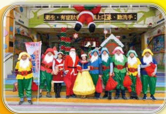
▲ 耶誕節散播平安歡樂