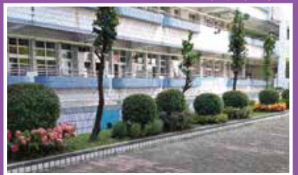
▲花園種植美麗的花朵植物