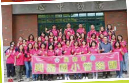
▲ 支持各項社團發展