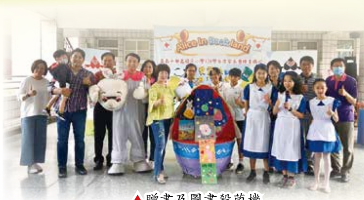
▲ 贈書及圖書殺菌機