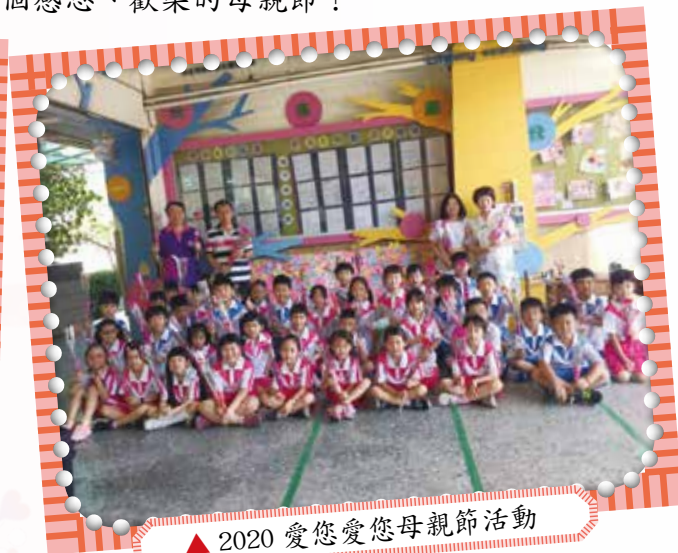
▲2020 愛您愛您母親節活動