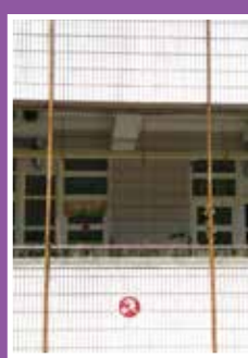
▲清淨空氣綠牆工程

總之，總務處以服務全校教職員工生為目標，並與教務處、學務處、輔導處、會計室、人事室及家長會、志工團合作，共創一個安全、舒適及美感的校園環境。