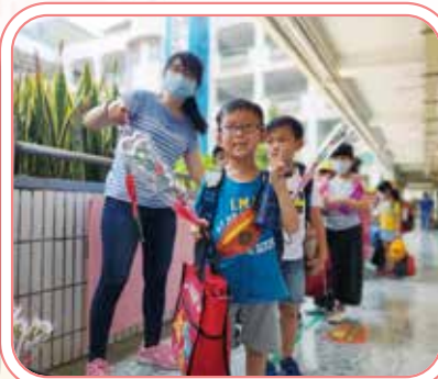
▲獻上一朵康乃馨謝謝家人的照顧