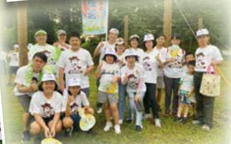
▲ 2020 反毒青春健行拒絕性別暴力