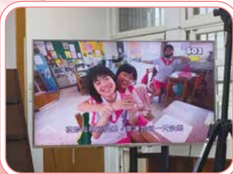
▲媽咪希望您每天都快樂