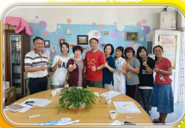
▲ 家長會志工團攜手合作