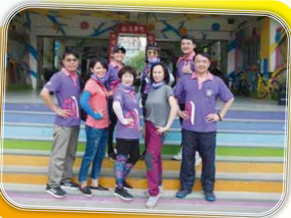
▲嘉油鐵馬追風行逗陣行

The Best Teammates of the Parent Teacher Association (PTA)