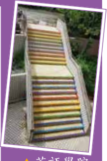
▲英語學院樓梯彩繪