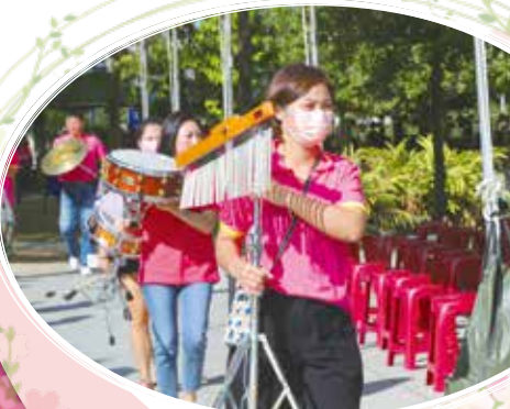
▲ 支援嘉義市音樂比賽