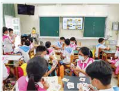
▲ 自製桌遊，引發對話

哲學家馬丁布伯 (Martin Buber) 的對話準則，不證自明的在課堂中成為師生與生生之間的默契，沒有固定答案，卻充滿著每個學生的生活實踐以及從長者得到的人生智慧。