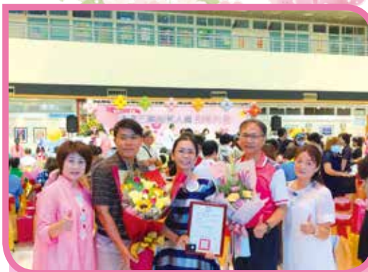
▲ 109 年績優志工表揚