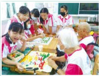
▲ 在學生的巷弄日照中心，與銀髮族同樂，行動關懷