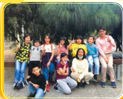
◀家長會旅遊活動 澀水森林步道、 921 地震教育園區 留下親子同行的 美好回憶！