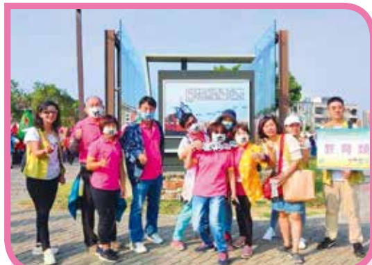
▲ 參與嘉義市 109 年國際志工日活動