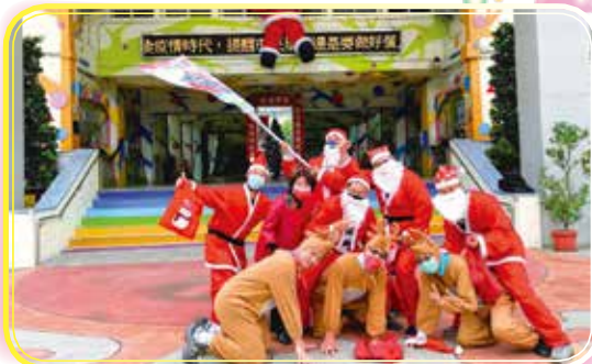
◀耶誕佳節一早 帶給孩子歡樂 的家長會