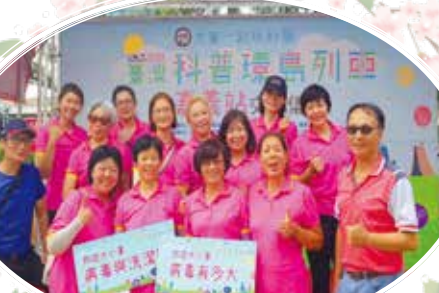
▲ 支援科普列車活動