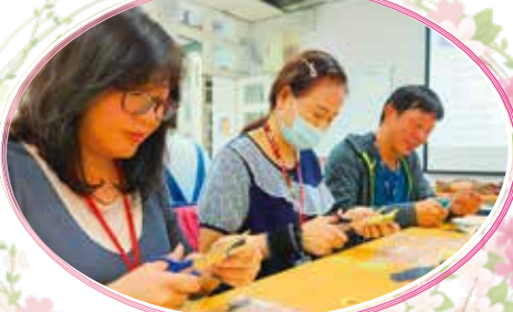
▲ 志工特殊訓練暨志工成長班