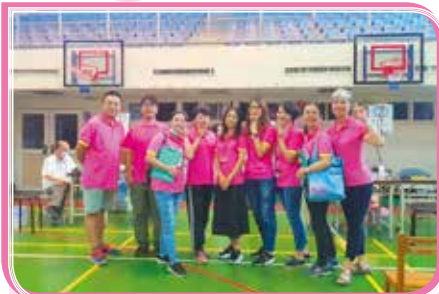
▲ 支援校內健康檢查