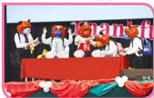
▲ 英語日志工戲劇表演 「一個不能沒有禮物的日子」

一個人可以走得快，一群人可以走得遠！讓我們一起往前走下去，共同創造美好，安心的興嘉。「興嘉就是我家」！