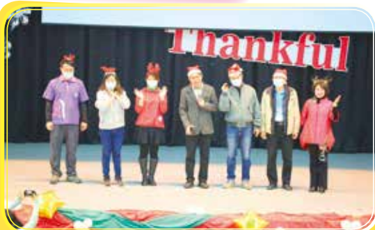
▶英語日暨耶誕 節慶祝活動， 家長會與孩子們 同樂