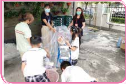
▲ 志工協助全校師生進行資源回收