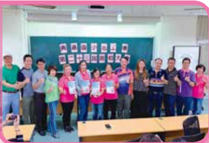
▲ 109 年幹部交接會議