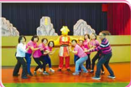
▲ 志工演出《齊天大聖大戰惡視力》 宣導視力保健重要性