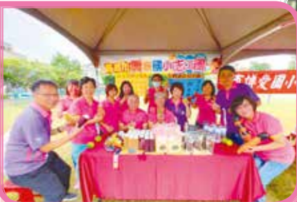
▲ 參與嘉義市狂想亞洲 - 志工嘉年華活動