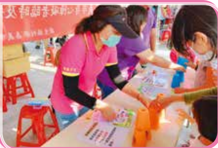
▲ 支援桃城 109 年國際家庭日活動