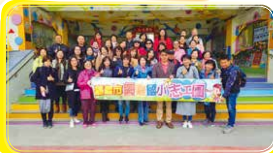
▶家長會與志工團 和樂融融