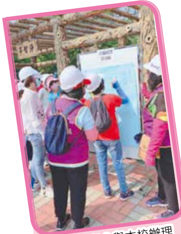
▲ 協助與參與本校辦理 嘉義市防災觀摩演習