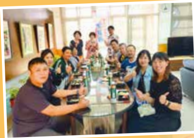
▲家長會在校長室午餐的約會，共同討論校務發展