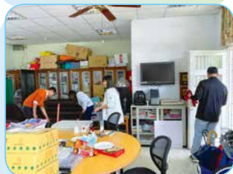
▲返校打掃消毒抗疫