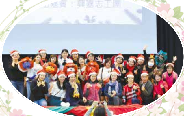
▲ 「一個不能沒有禮物的日子」演出人員合影