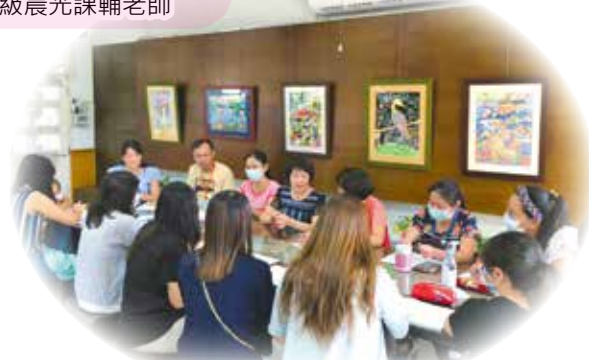
▲ 志工團 109 年幹部交接會議