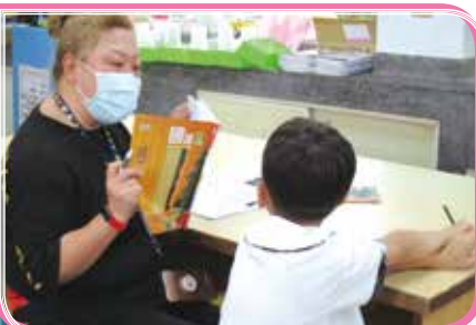
▲ 志工擔任低年級晨光課輔老師