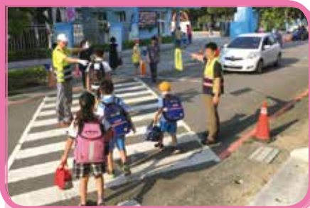
▲ 導護組協助學生上下課的交通安全維護