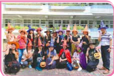
▲ 故事組志工配合萬聖節妝扮說故事