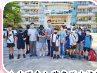
▲出發參加菊島盃少棒賽