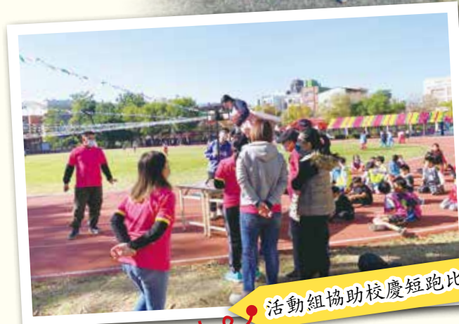
活動組協助校慶短跑比賽