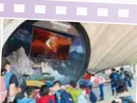
▲車籠埔斷層園區 戶外教學