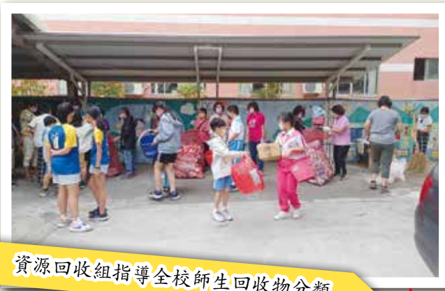
資源回收組指導全校師生回收物分類