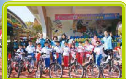
▲ 30 週年校慶摸彩活動－學生篇