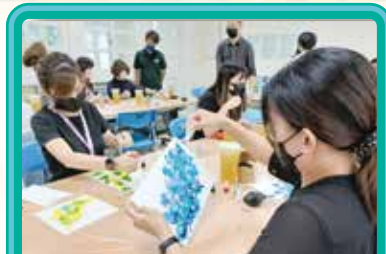
▲ 酒精墨水成長課程