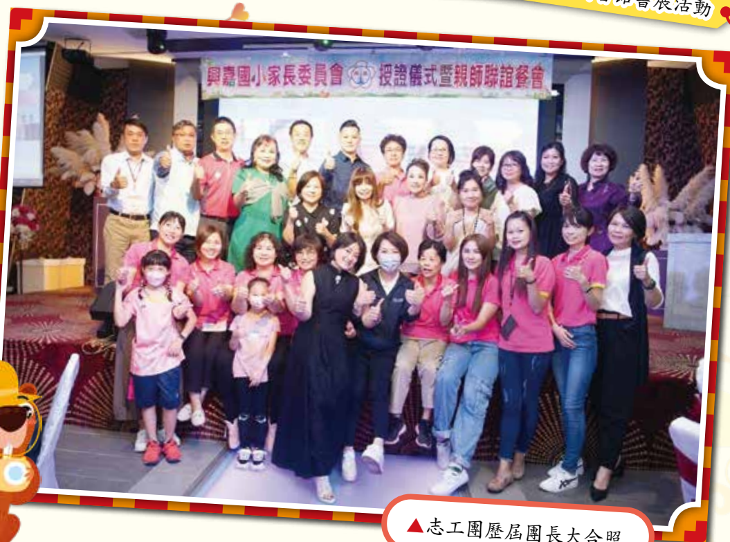
▲志工團歷屆團長大合照