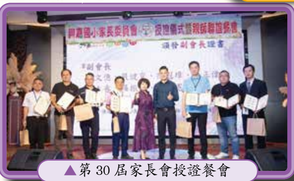
▲ 第 30 屆家長會授證餐會