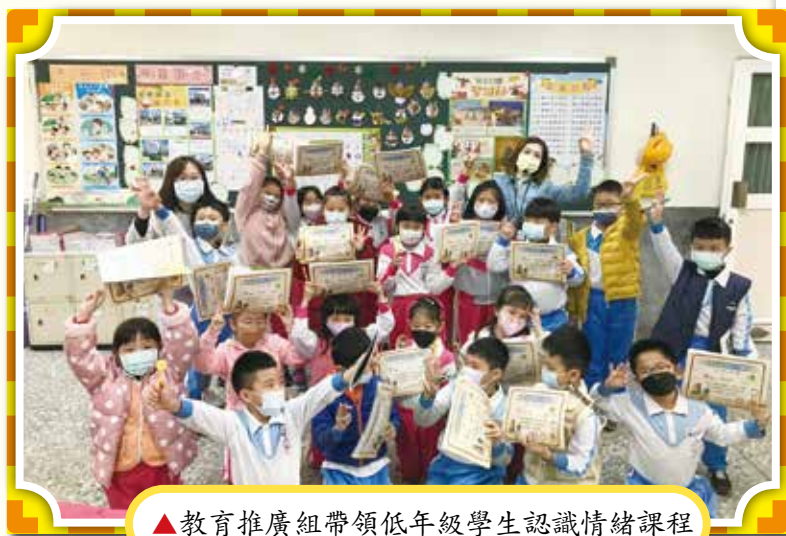
▲教育推廣組帶領低年級學生認識情緒課程