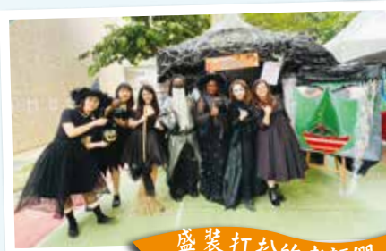
盛裝打扮的老師們