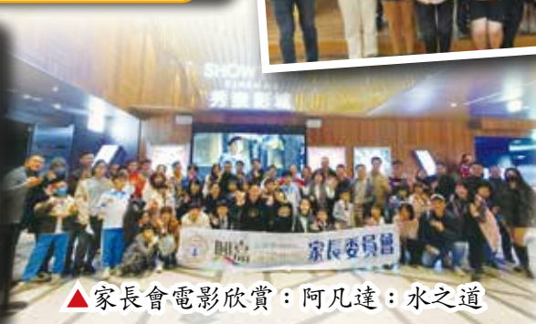
▲ 家長會電影欣賞：阿凡達：水之道