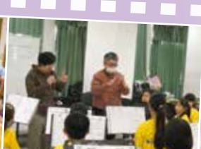
▲日本管樂大師 藤重佳久講座