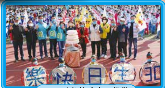
▲ 30 週年校慶生日禮讚