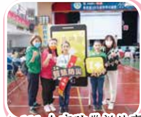
▲111 全市防災說故事 比賽榮獲第二名