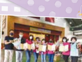
▲導護志工、老師及 愛心商店表揚

兩人都有出手，當然都有錯，只是動手的理由不同；可以合理化互相傷害的行為嗎？「開玩笑」、「跟他玩」常常是許多衝突或意外發生的起因。再好玩的遊戲都需要是在「合法、安全、不傷害人」的前提之下，而不是不顧後果，先玩再說。