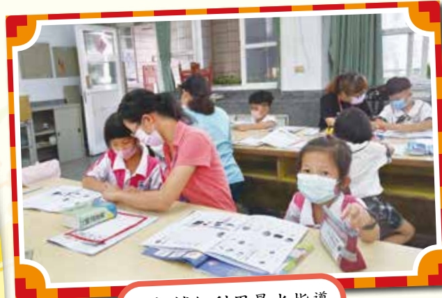
▲課輔組利用晨光指導