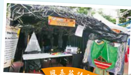
興嘉英語學院闖關攤位

在所有興嘉英語學院老師們的全力合作下，生動有趣的闖關活動內容，讓參加的各校學生，都有一種意猶未盡的感覺，此次活動的設計更展現出興嘉英語學院的創新風格。