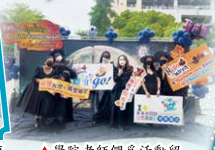
▲ 學院老師們爲活動留下美美的紀錄