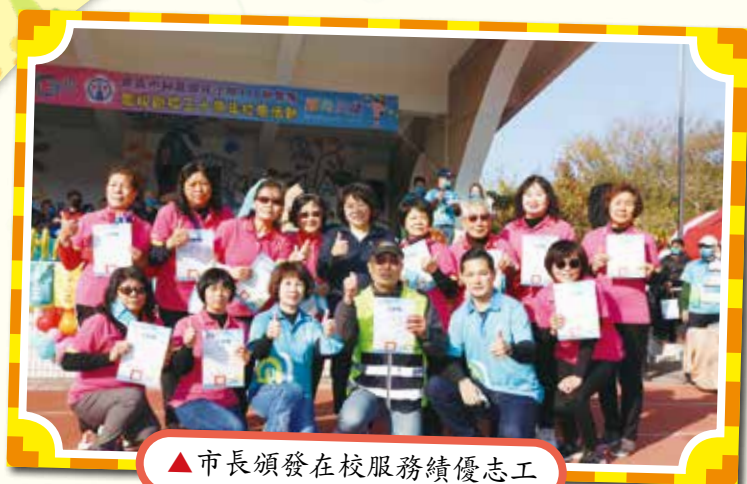
▲市長頒發在校服務績優志工