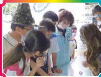
▲ 校長和興嘉寶寶一起闖關