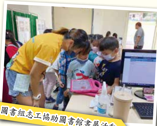
圖書組志工協助圖書館書展活動