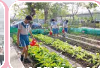
▲食農教育親土教育