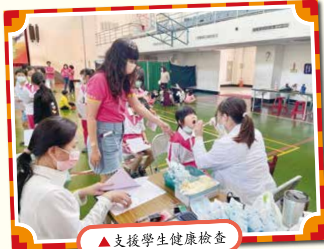
▲支援學生健康檢查