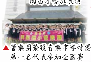
▲管樂團榮獲音樂市賽特優 第一名代表參加全國賽