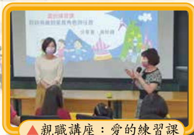
▲ 親職講座：愛的練習課