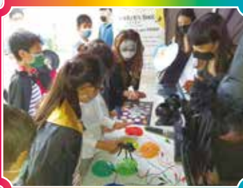
▲ 緊張刺激的闖關活動