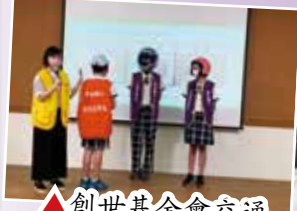
▲創世基金會交通 安全宣導