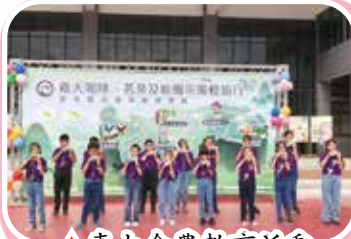
▲嘉大食農教育活動 陶笛才藝班表演

小聰覺得好玩，把球往小明臉上丟；小明一點也不覺得這樣好玩，只是覺得不舒服、難堪、疼痛，當然會生氣的反擊，這樣的玩不是玩，而是傷害。而生氣的反擊也不是正當防衛，因正當防衛是有法律上的成立條件。法律規範有非常多的精神和立意，目的都是為了解決人民的困難，讓大家在規範中，使用正確的策略來因應各種不同的狀況。