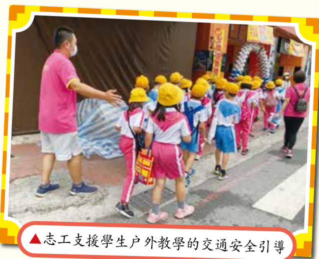
▲志工支援學生戶外教學的交通安引導