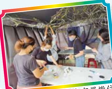
▲ 老師們齊心合力布置攤位