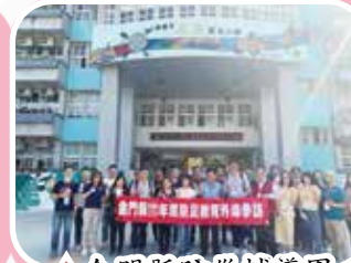
▲金門縣防災輔導團 蒞校參訪