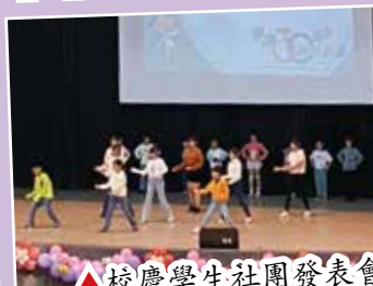
▲校慶學生社團發表會