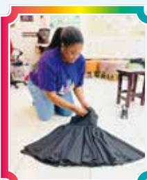
▲ 新外師 E11e 製作老師們的服裝