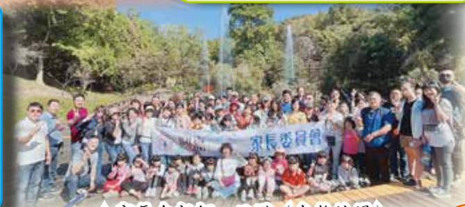
▲ 家長會親師一日遊（東勢林場）