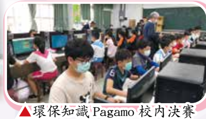
▲環保知識 Pagamo 校內決賽