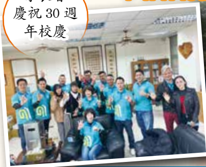
▲ 30 週年校慶摸彩活動－教師篇