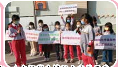
▲本校學生擔任小店長至愛 心商店剪綵