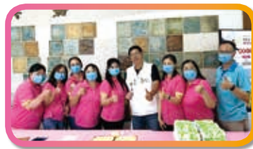
▲承辦市府績優志工表揚大會

數不完的活動，數不完的支援，但興嘉志工都是「歡喜做、甘願受」，每次活動出來報名都秒殺，還常常被抗議搶不到，這就證明了興嘉志工團永遠都是學校最大的人力銀行，永遠支持著學校。但我們也不只在校內喔，校外支援也不落人後，科學 168 學校負責闖關組，也是有我們的身影。這一切都要感恩辛苦的志工夥伴，謝謝大家一年來的付出，明年我們再接再厲，有您們在，興嘉寶寶是最幸福的。