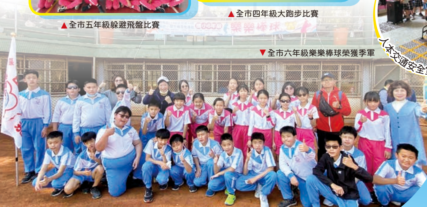
▼全市六年級樂樂棒球榮獲季軍