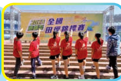
▲2023年港都盃全國田徑錦標賽