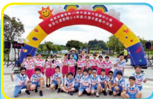
▲全市四年級大跑步比賽