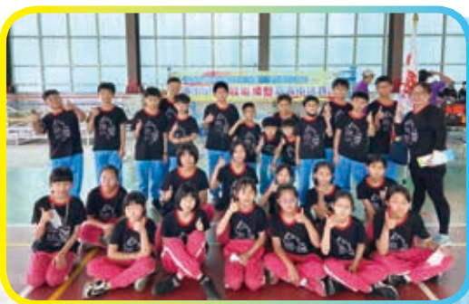
▲全市五年級躲避飛盤比賽