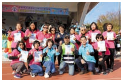
▲校慶表揚績優志工