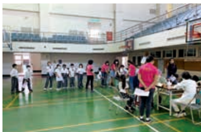
▲一、四年級健康檢查