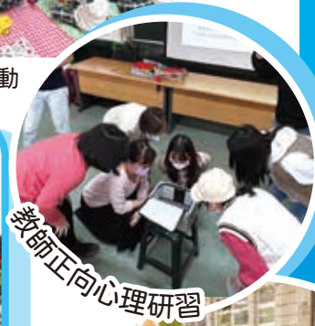
教師正向心理研習