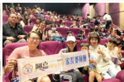
▲ 超級瑪利歐兄弟的遊戲世界 共度輕鬆愉快的親子時光