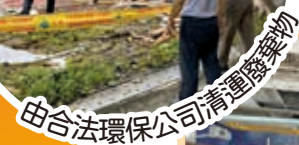
由合法環保公司清運廢棄物