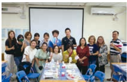
▲志工成長課程 - 流體熊