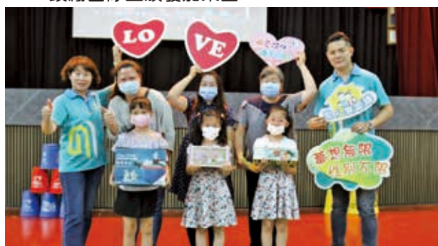
▲ 親子探索體驗活動