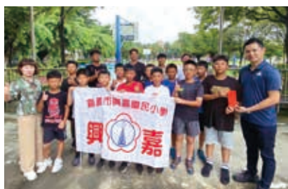
▲ 2023 菊島盃的賽事 鼓勵團隊並頒發加菜金