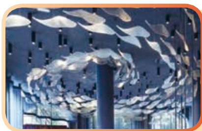
▲共讀站完工後魚造型藝術立體浮雕模擬示意圖