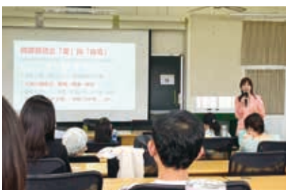
▲ 親職講座 - 最難的一堂課