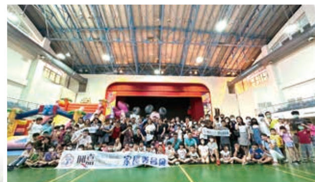
▲ 家長會小市集親子活動