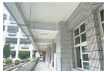
▲前走廊造型梁柱拆除完成

位於本校教學大樓南棟西側 1 樓的原夢想館 (圖書館)，於民國 101 年獲嘉義市政府經費補助進行整修後迄今已 10 餘年，在 111 年 1 月 -7 月進行教學大樓南棟耐震能力補強暨廁所修繕工程期間，因提升耐震係數的需要而進行擴柱工程，使得館內原柱子旁連接的書櫃等也被切割，基於耐震能力補強工程經費使用效益及圖書館空間重新整體裝修考量下，決定在耐震能力補強工程結束後，另案申請經費以進行圖書館的裝修工作，也使得本校圖書館暫時安置在教學大樓北棟西側地下 1 樓近一年的時間。