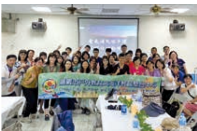
▲全市戶外教育參訪交流研習