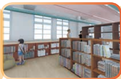
▲共讀站完工後閱讀區域模擬示意圖