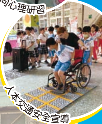
人本交通安全宣導