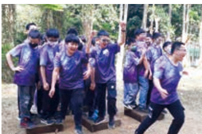
▲六年級探索體驗活動