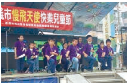
▲陶笛樂團受邀參加 2023 嘉義市慢飛天使快樂兒童節活動演出