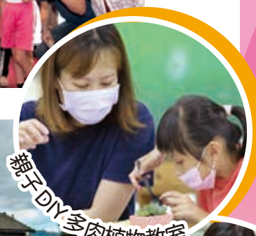
親子DIY多肉植物教室