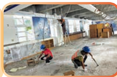
▲拔除拆除地面地板後殘留的釘子