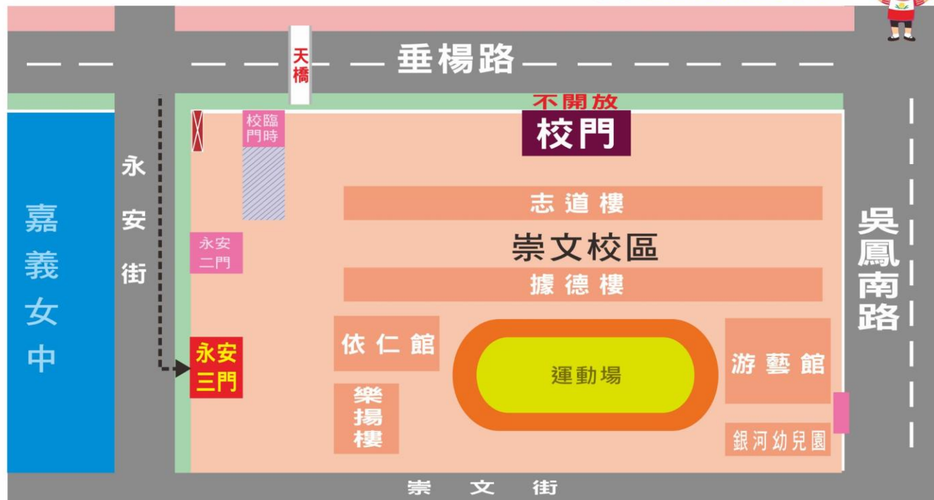
附圖一 崇文國小地圖